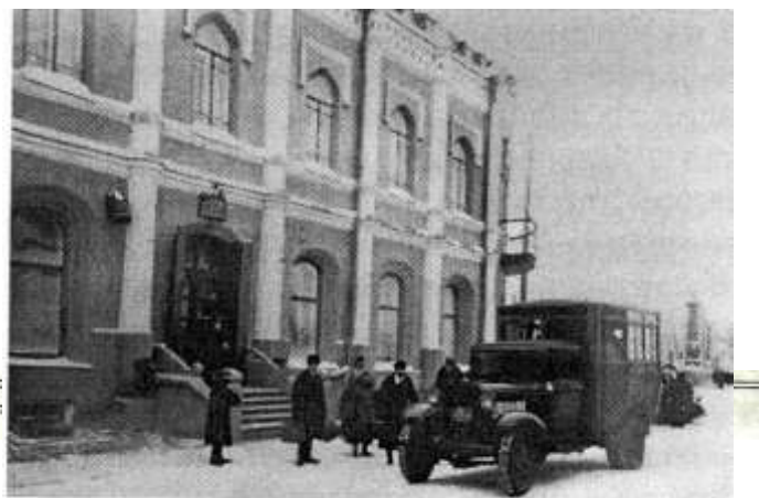
Здание института курортологии, 1925 г.

крупная медицинская база, начали поступать раненые и увечные. Их привозили все больше и больше. В госпиталях стала остро ощущаться нехватка медикаментов. Поэтому особую важность приобрели немедикаментозные методы лечения – лечебные грязи, лечебные воды, массажи, кумысолечение. В 1919 г. был подписан