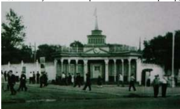
Новая ограда и старые ворота стадиона «Динамо»

Динамо́вский стадион не прекращал функционировать и в тяжелые военные годы. Об этом, в частности, свидетельствует газета «Красное знамя». Например, она писала о том, что в январе 1942 г. на стадионе состоялся большой праздничный карнавал, посвященный встрече Нового года. При этом каток был украшен елками, была устроена теплушка, играл духовой оркестр. Коньки выдавались напрокат всем желающим. В 1944 г. газета помещает репортажи об открытии летнего спортивного сезона, о городском общеузовском празднике в честь окончания очередного учебного года, о проведении соревнований по легкой атлетике, футболу и волейболу, велогонкам и городкам. На фотографиях тех лет, сделанных на стадионе «Динамо» видны люди в погонах, как среди зрителей, так и во время процедур открытия мероприятий и награждения победителей соревнований. Этот факт как бы подчеркивает ведомственную принадлежность стадиона. С 1944 г., когда Томск получил статус областного центра, общественная и культурная жизнь города поднялась на более высокий уровень, что не могло не отразиться на физкультурном и спортивном движении, средоточием которого были городские стадионы, в т.ч. стадион «Динамо».