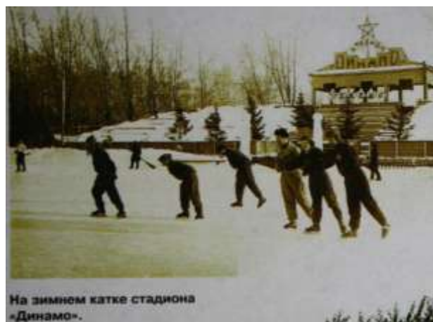
На зимнем катке стадиона «Динамо».

В 50-годы отмечается небывалый подъем томского футбола. Во время матчей и мастеров, и начинающих футболистов трибуна стадиона «Динамо» неизменно переполнена. Можно сказать, в эти годы родилось, выросло и расширилось до необычайных размеров сообщество томских болельщиков футбола. И были к тому основания. Футболисты Томска все чаще заявляют о себе не