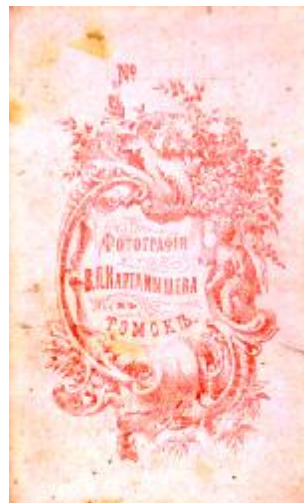
Фотографии фотосалона Картамышева, из коллекций В.Манилова, Э.Майданюка.

1885г. были закуплены новые фотоаппараты и бромо-желатиновые пластинки, позволявшие значительно сократить время съёмки. Расширившиеся возможности ещё более добавили популярности фотографии Картамышева, были заказаны фирменные паспарту, и оформление снимков не стало уступать лучшим российским фотосалонам. К сожалению, мало сохранилось фотографий выполненных в ателье Картамышева, а те, что остались, находятся в весьма ветхом состоянии.